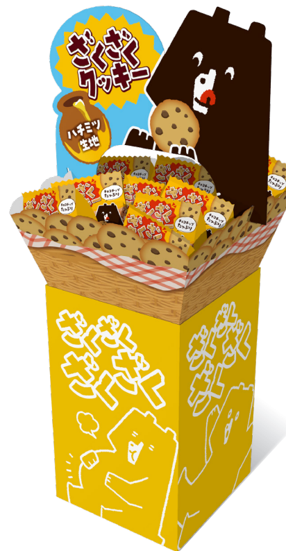
デザイン例① 看板+トレー：カラー 土台：単色