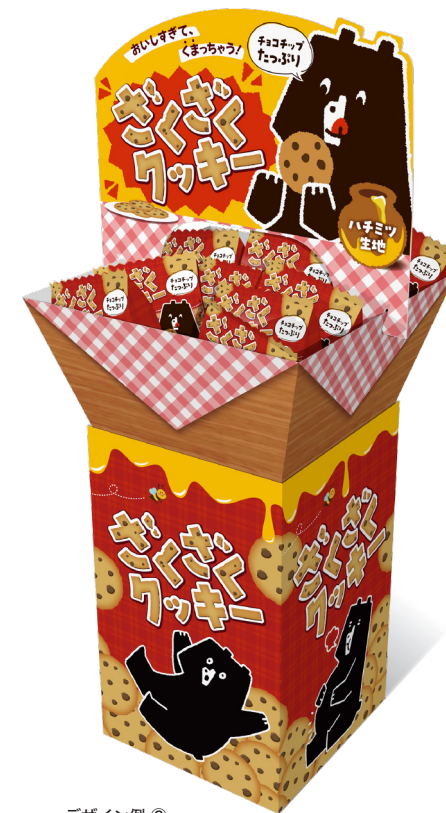
デザイン例② 全体：カラー

ご希望のデザイン、サイズで製作が可能です。まずはお気軽にご相談ください。予告なく仕様変更等をする場合がございますので予めご了承ください。