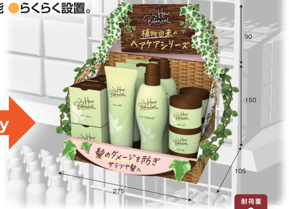
サイドネット陳列