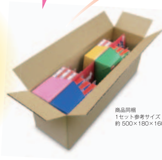
商品同梱 1セット参考サイズ： 約 500×180×160mm